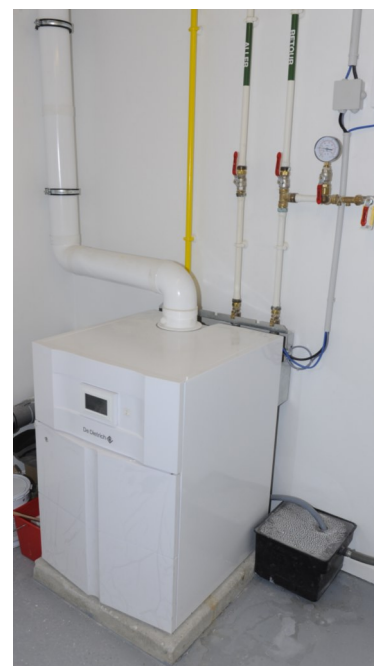
Chaudière De Dietrich