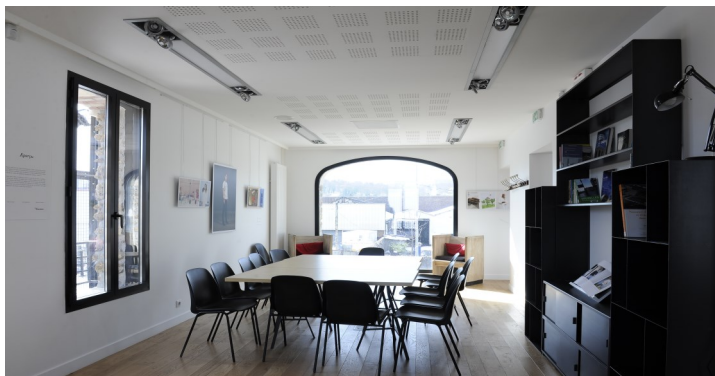
Salle de réunion premier étage